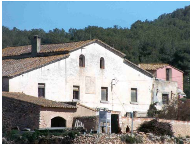
Les Torres (Marta González/CF Margalló)